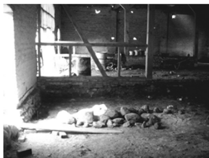
Zustand der Scheune beim Baubeginn