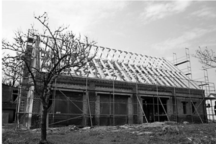
Der Dachstuhl ist errichtet.