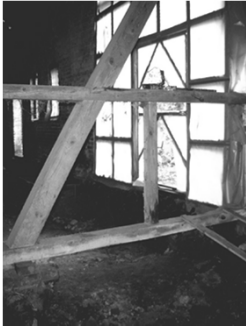
Bauzustand Ende September 2003