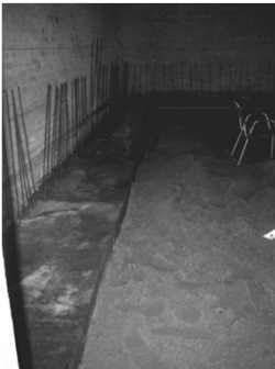
Bauzustand am 16. Oktober 2003

Die Fundamente im Innenraum sind fast fertig.