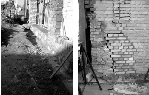
Der Feldsteinsockel und die Mauern des Gebäudes werden saniert.