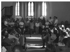
Chor des Einstein-Gymnasiums Angermünde in der Kirche

Tombolaziehung durch Günther Jauch vor über 500 Gästen aus Berlin und Angermünde/Altkünkendorf