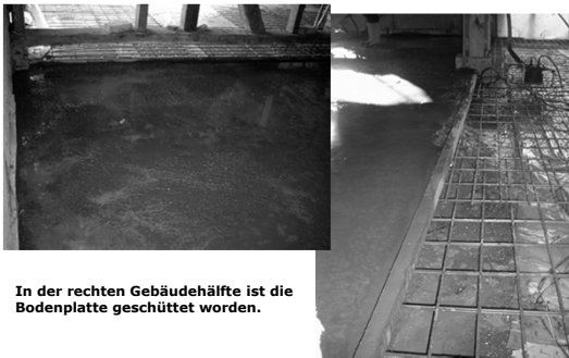
In der rechten Gebäudehälfte ist die Bodenplatte geschüttet worden.