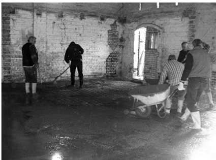
Der flüssige Beton wird verteilt, geglättet und vermessen.