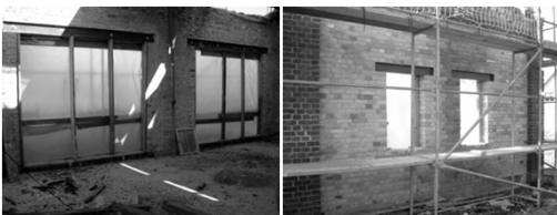
Alle Fenster- und Türöffnungen sind vorbereitet. Die Außenwände sind saniert.