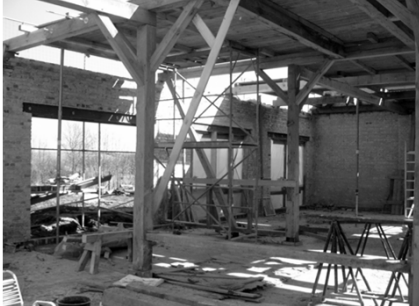
Alle Wände sind von außen saniert. Die Fensteröffnungen sind komplett.