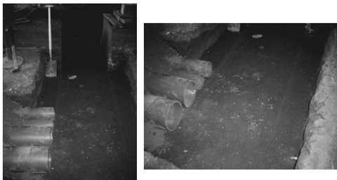
Bauzustand am 16. Oktober 2003

Die Versorgungsrohre, durch die später einmal Strom und Wasser in das Gebäude gelangen werden, sind verlegt und werden in Kies eingebettet.