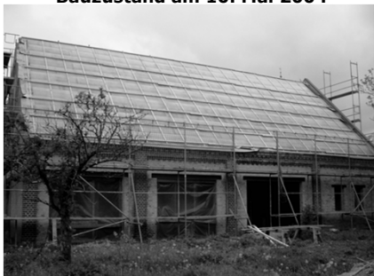
Die Weichfaserplatten sind auf dem Dachstuhl aufgebracht.