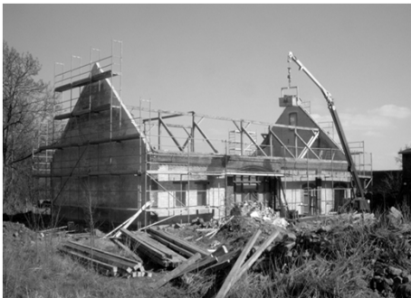
Der morsche Dachstuhl ist abgetragen und wird nun zügig erneuert.